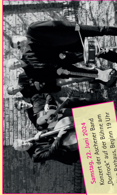
Samstag, 22. Juni 2024 Konzert der Aschener Band „Dorfröck“ auf der Bühne am alten Rathaus, Beginn 19 Uhr

Ausstellungszeiten: In den Geschäften: zu den Öffnungszeiten In den Galerien: Dienstag bis Freitag: 10–12 Uhr und 15–18 Uhr Samstag: 10–13 Uhr und 16–19 Uhr · Sonntag: 13–18 Uhr Im alten Rathaus: Montag: 18–20 Uhr Dienstag bis Freitag: 10–12 Uhr und 15–18 Uhr Samstag: 10–13 Uhr und 16–19 Uhr · Sonntag: 13–18 Uhr Ausstellungseröffnung: 17. Juni 2024, 18 Uhr